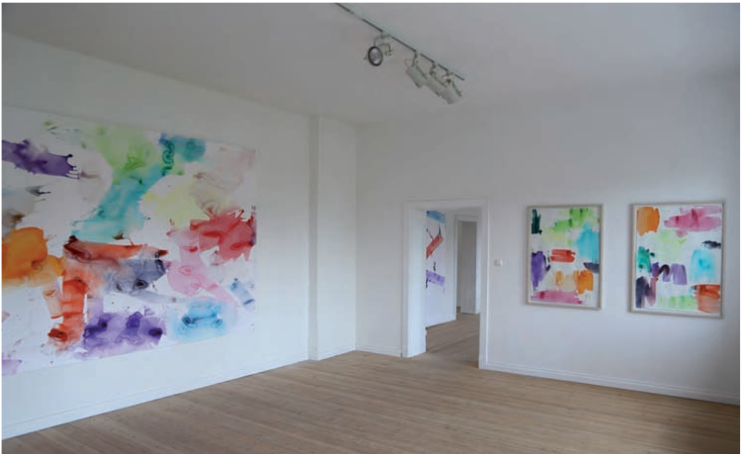
Chaos, Aquarell, 210 x 320 cm, 2012