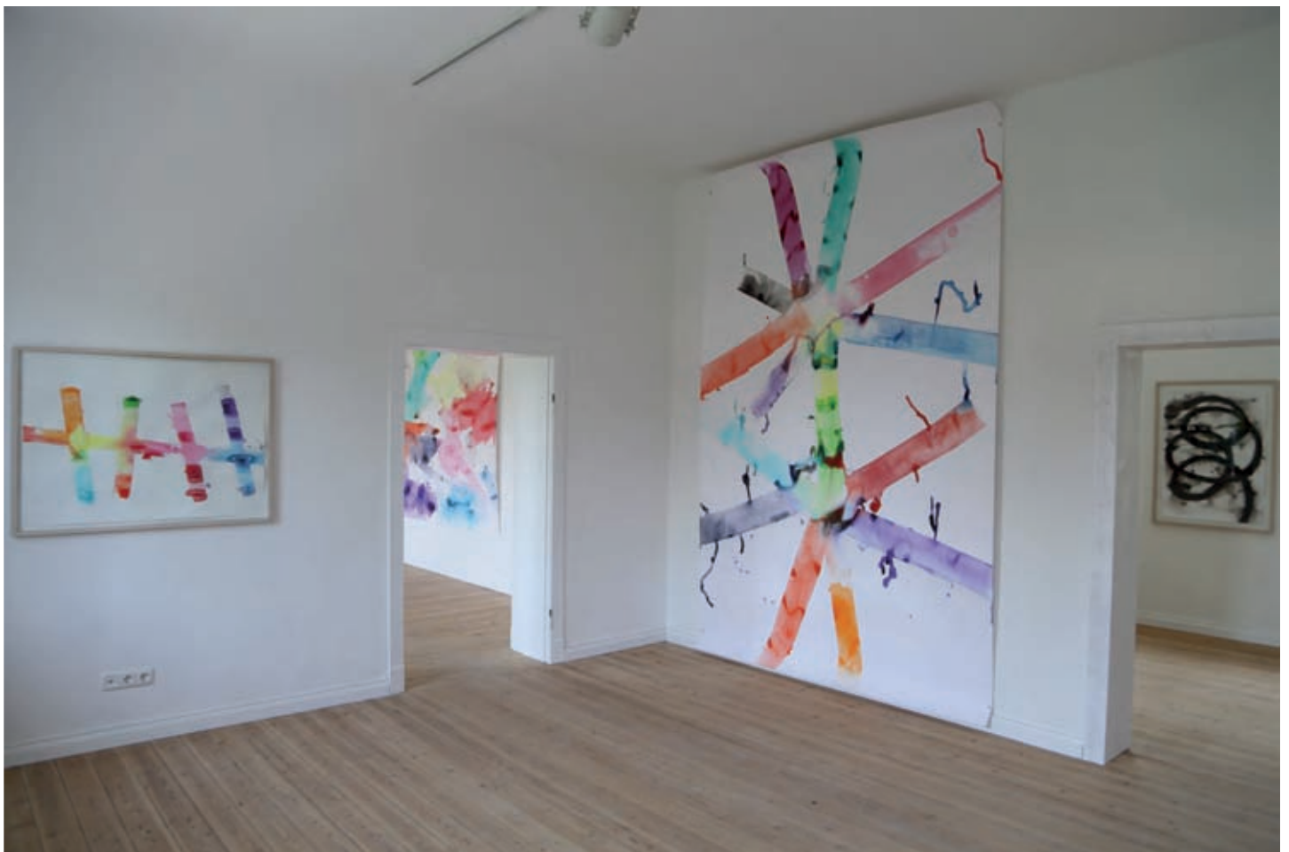
4 = 5, Aquarell, 75 x 105 cm, 2016