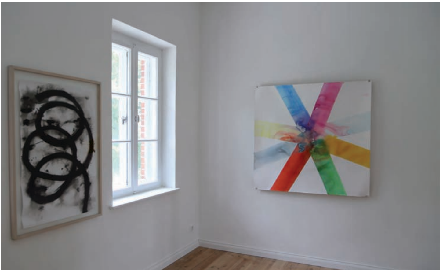
NO-IS, Tusche, 100 x 70 cm, 2015