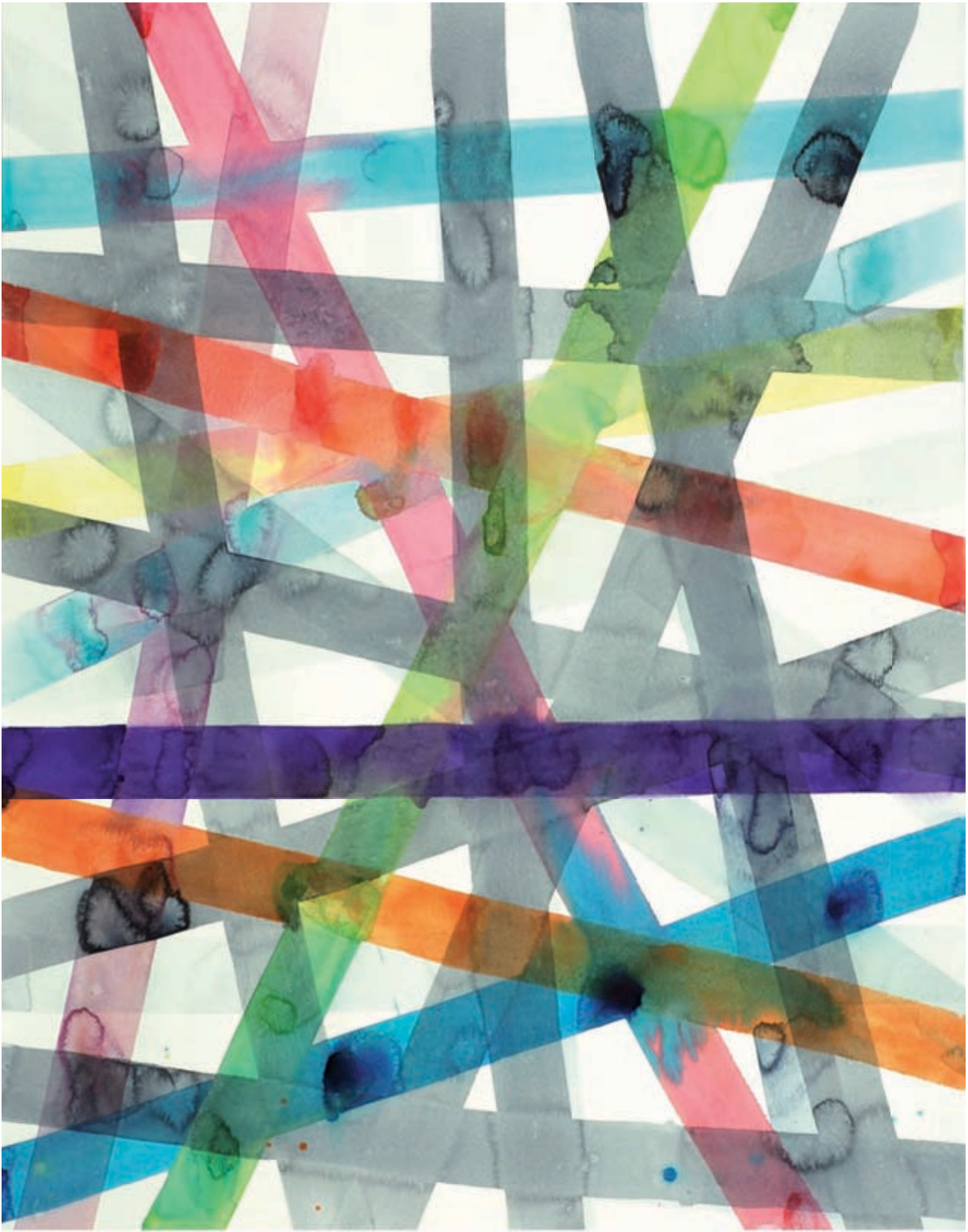
Netz, Aquarell, 70 x 100 cm, 2007