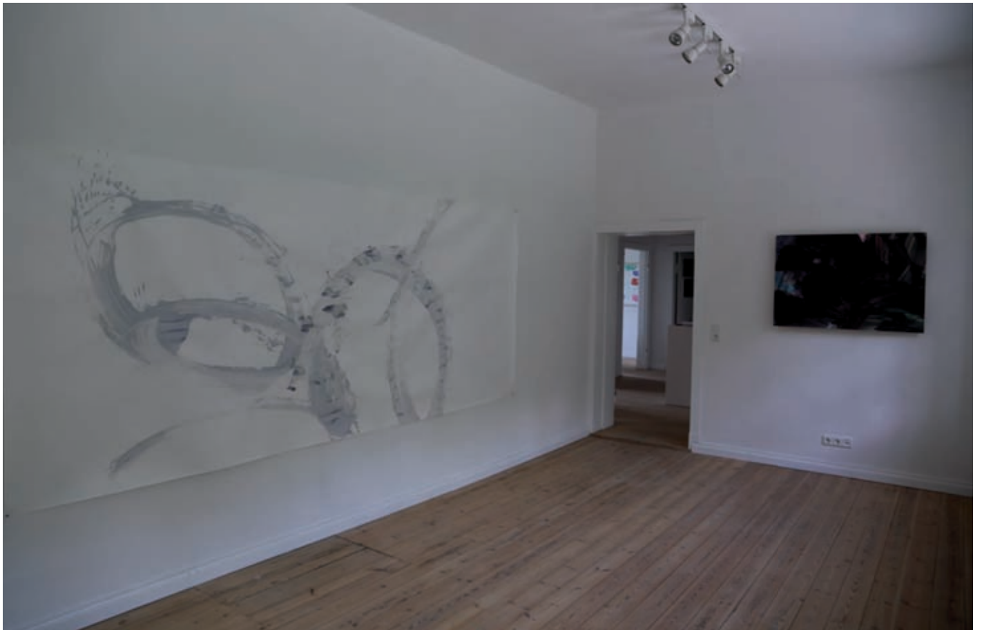
Loop, Acryl, 150 x 365 cm, 2016