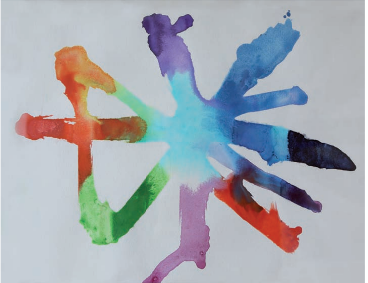
Aquarell, 30 x 40 cm, 2013