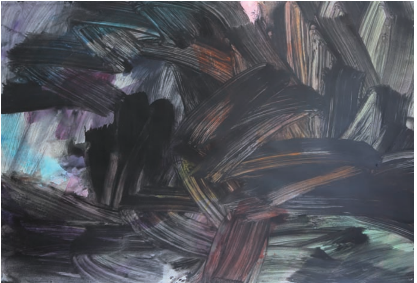
Over, Acryl, 75 x 105 cm, 2016