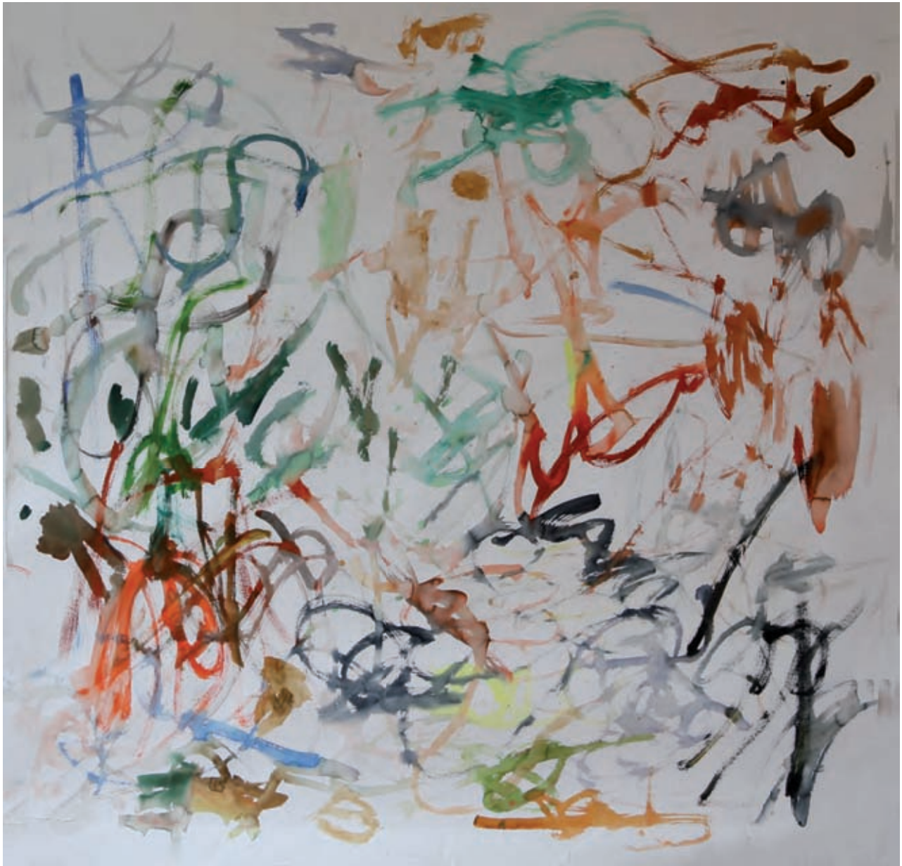
Scribe, Aquarell, 149 x 153 cm, 1993