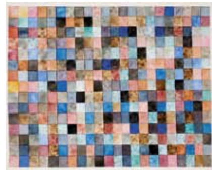
Howard Smith, Farbraster # 3, 2008

Mit kaum einer anderen künstlerischen Technik lässt sich der spontane, direkte und emotionale Ausdruck so kongenial transportieren. Sie bildet den Gegenpol zu konzeptuellen Strategien und der Glätte digitaler Me-dien. Ihre ungeheure Sensibilität ermöglicht feinste Nu-ancierungen ebenso wie die Intensivierung der Farbe bis hin zu einer leuchtenden Strahlkraft.