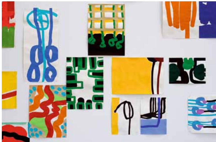
Markus Weggenmann, O.T. 2008 (© redesign)