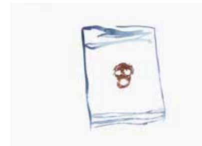
Norbert Prangen-berg, Bolsena Songs, Nr. 51 (© Prolitteris Zürich)

Ausdrucksform. Die starke Sinnlichkeit dieses Mediums eröffnet grundlegende Fragen nach den Beziehungen zwischen Farbe, Raum, Licht und der Wahrnehmung des Betrachters.