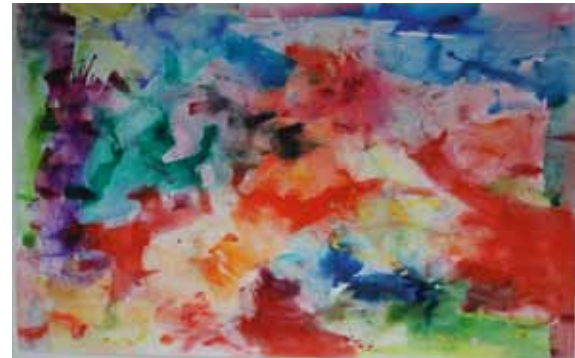
Klaus Schmitt, O.T. 2011