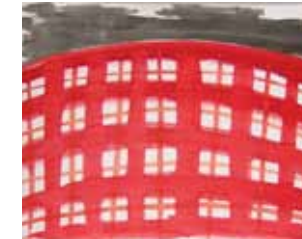
Günther Förg, O.T. 2004