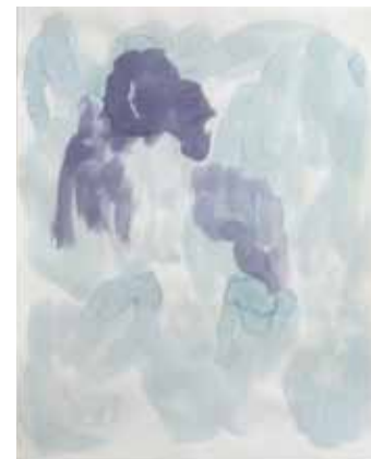
Christiane Fuchs, O.T. 2009